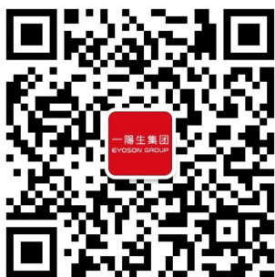
一阳生集团公众号